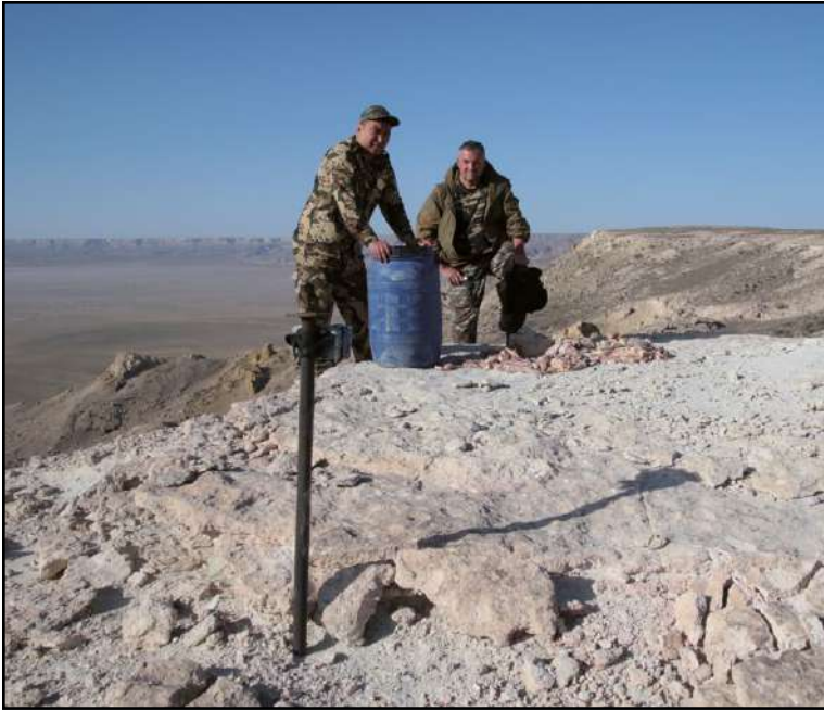
Участники проекта оборудуют приваду № 1. 10.04.2018 г.

Project participants are setting up the feeding station № 1. 10/04/2018.