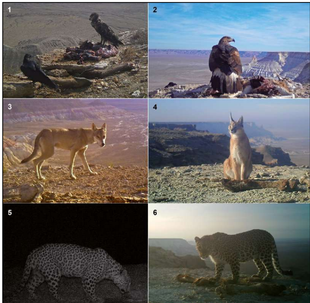
Fig. 5. Steppe Eagle ( Aquila nipalensis ) and the Raven on the feeding station № 1, 07/09/2018 – 1, Golden Eagle ( Aquila chrysaetos ) and the Raven on the remains of the Ustyurt sheep outside the stationary feeding station, 16/11/2018 – 2, Wolf ( Canis lupus ) on the feeding station № 3, 25/11/2018 – 3, Caracal ( Caracal caracal ) on the feeding station № 2, 22/11/2018 – 4, Persian leopard ( Panthera pardus saxicolor ) on one of the feeding stations at the territory of the Ustyurt State Nature Reserve, 06/11/2018 – 5 and 07/12/2018 – 6. Photos from the camera traps set up by the authors.