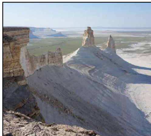
Устьюрт. Ustyurt.

По мнению специалистов, основной лимитирующий фактор для падальщиков в Казахстане, в том числе и в Мангистау – это дефицит кормовой базы в результате резкого снижения поголовья домашних и диких копытных животных, особенно – сайгаков ( Saiga tatarica ) и джейранов ( Gazella subgutturosa ), в последние десятилетия, прошедшие после распада Советского Союза (Скляренко и др., 2012; Плахов, 2006; 2009). Кроме того, в данном регионе отмечены единичные случаи гибели грифов и стервятников от поражения электрическим током при контакте с воздушными линиями электропередачи средней мощности (Левин, Куркин, 2013; Пестов и др., 2015).