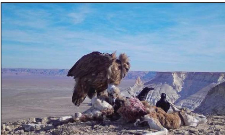
Рис. 4. Чёрный гриф и вороны на останках уриала ( Ovis vignei arkal ) вне стационарной привады. 16.11.2018 г. Фото с фотоловушки, установленной авторами.

Белоголовый сип в 2016 г. был отмечен лишь на приваде № 1 в светлое время в течение 4 суток (около 2% от общей продолжительности наблюдений), в том числе 30.08.2016 г. в течение 6 минут – совместно со стервятником, грифом и несколькими воронами. На фото с фотоловушек